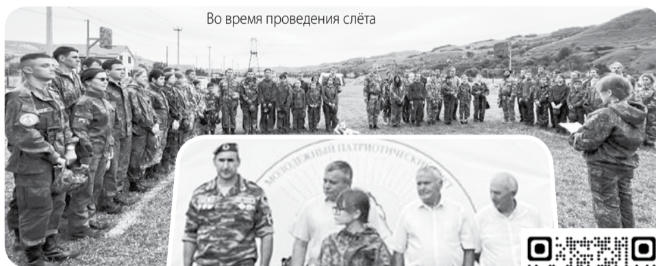
Во время проведения слёта